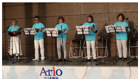
ダンス・音楽発表会

毎年8月に池袋サンシャインシティ地下1階「噴水広場」で開催。池袋コミュニティ・カレッジとメゾンカルチャークラブの受講生の他、一般団体も参加する大型イベント。