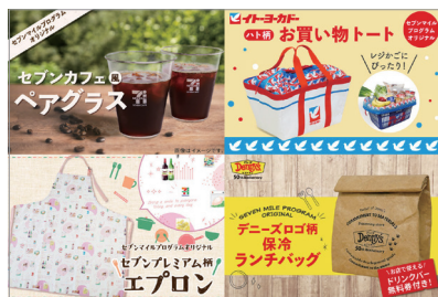
セブンマイルプログラム(※)特典 提供先: (株)セブン&アイ・ホールディングス