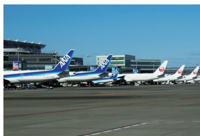
空港（羽田・成田）内特別見学