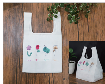
景品(オリジナルエコバック) 提供先:(株)セブン・フィナンシャルサービス

※ セブン&アイグループ各社や提携企業店舗のお買い物やお食事であまったマイルを、お好きなタイミングにお好きな特典に交換できるサービスのこと。