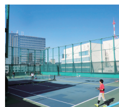
屋上テニスコート