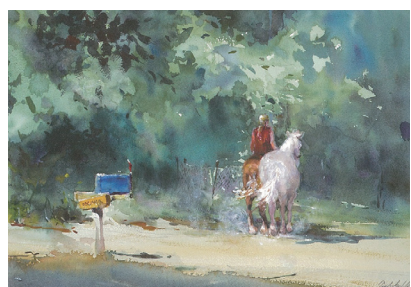
右近としこの透明水彩