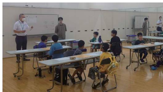
こども将棋交流戦

茶道・香道の各流派合同の茶会を毎年秋に東京・護国寺で開催しています。日頃のお点前の成果を披露します。(過去42回開催)