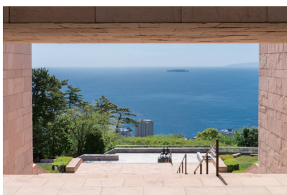
旅行雑誌とタイアップしたアート鑑賞ツアー