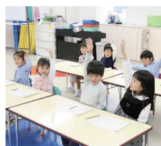
理英会アフタースクール池袋校