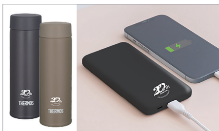
周年記念品(周年ロゴ入り水筒、モバイル バッテリー) 提供先:(株)クリエイトリック