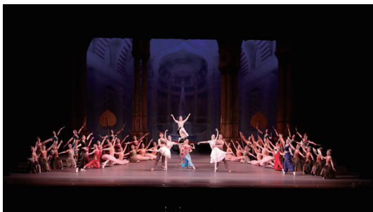
フライングダンシング

メゾンカルチャークラブ17店舗と池袋コミュニティ・カレッジの店舗ネットワークを活かした旬の講座開発により、同じ趣味や目的を持った仲間と知的好奇心を満たし、心の充足を得られる体験の場を提供しています。また店舗合同の発表会やイベントを定期的 to開催し、日ごろの成果を発揮いただく機会を通して活気あるスクールを目指していきます。