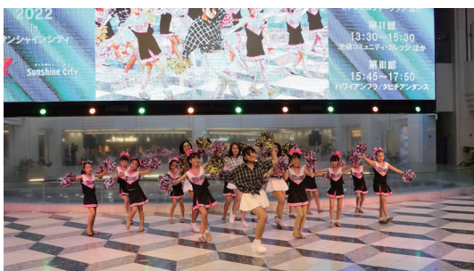
夏のダンスフェスティバル

多くのコート面数を使い細かいレベル分けにより練習を濃密に展開。ゲーム練習の他、新しいショットの習得、苦手克服などみっちりと楽しくテニスが出来ます。初めての方でも安心して楽しめるキャンパです。