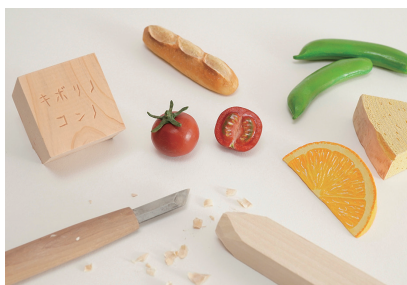
キボリノコンノ木彫り教室