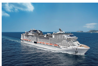
クルーズツアーや希少な観光列車の旅